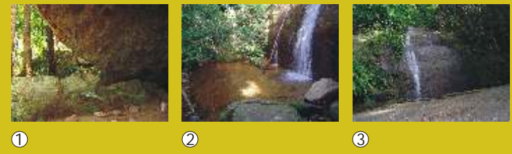
Acesso / Access

Cachoeira dos Primatas: final da Rua Sara Vilela - Jardim Botânico