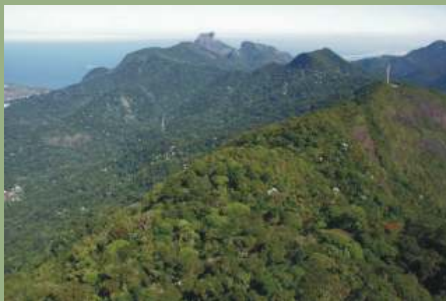
Serra da Carioca com Pedra da Gávea e Pedra Bonita ao fundo

Parque Nacional da Tijuca Sede Administrativa