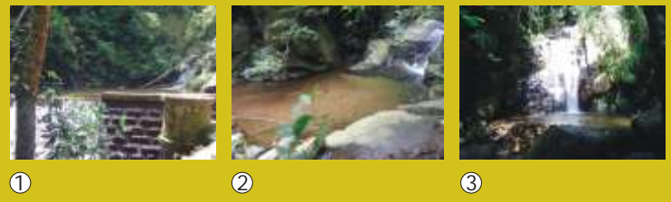
Acesso / Access

Cachoeiras do Quebra e Chuveiro: Estrada Dona Castorina - Horto